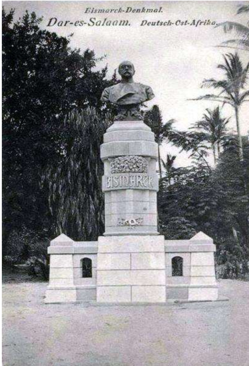
Eismarch-Denkmal. Dar-es-Salaam. Deutsch-Ost-Afrika.