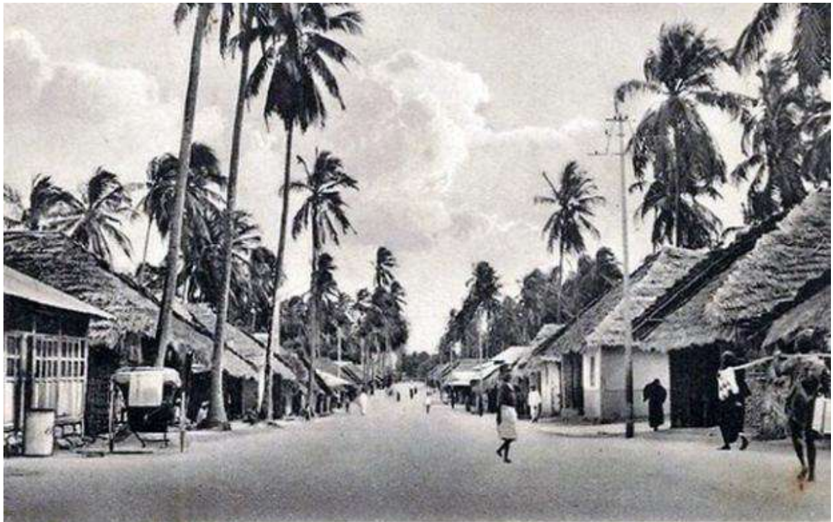
The Kitchwelle Street, Dar-es-salaam