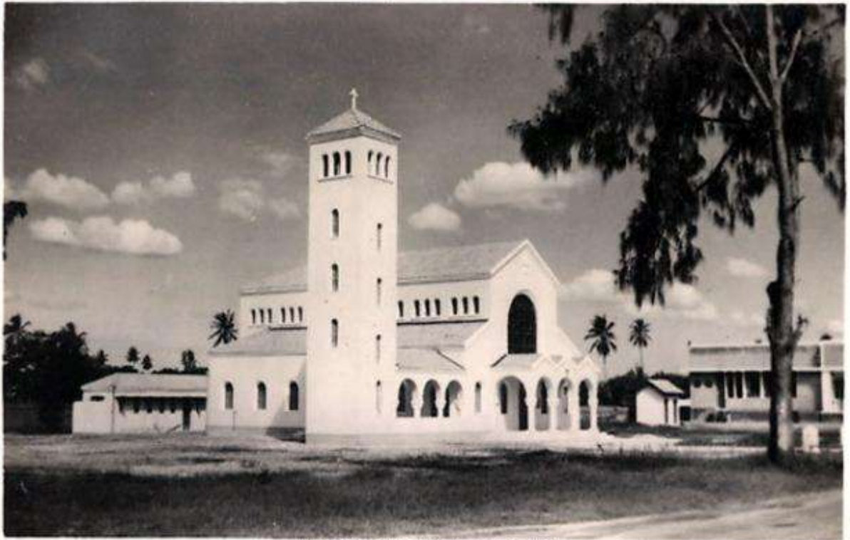
HELLENIC CHURCH, DAR-ES-SALAAM