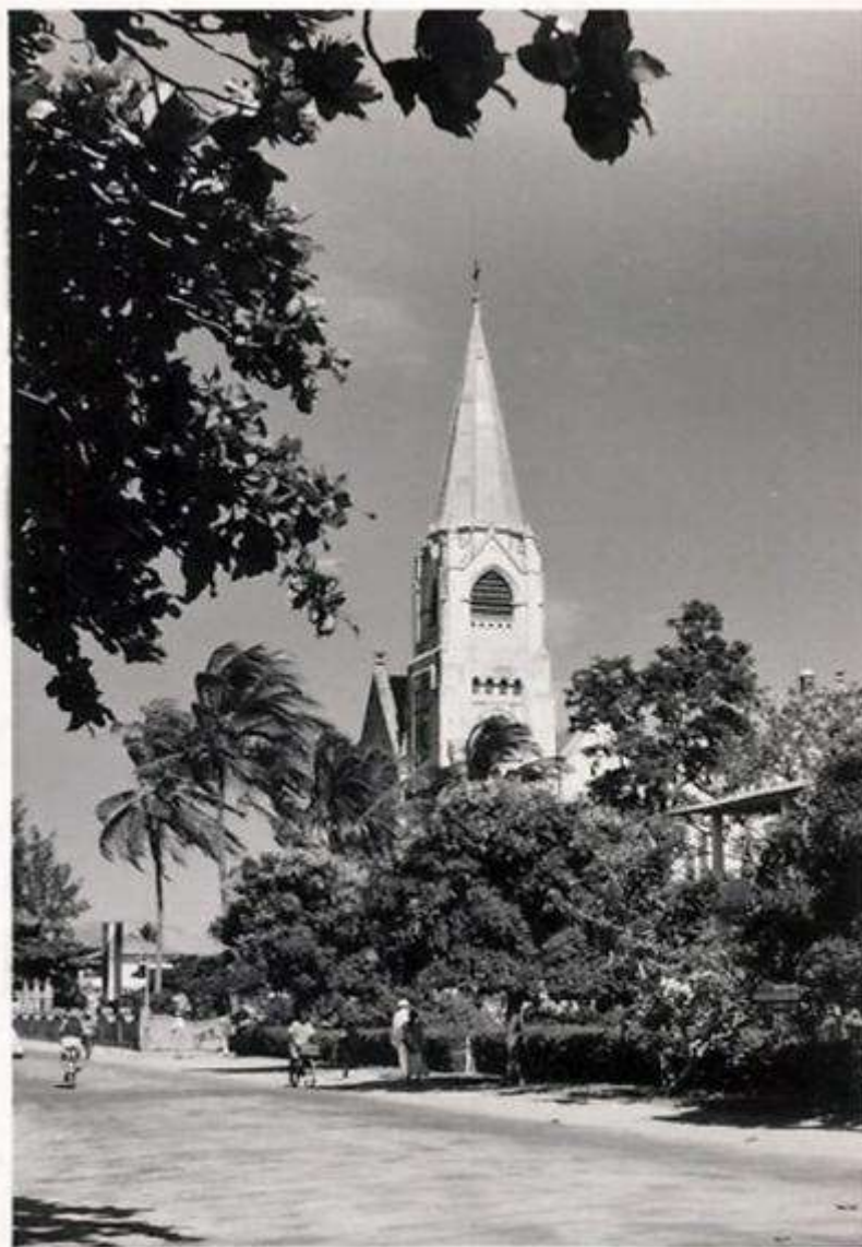
Dar es Salaam