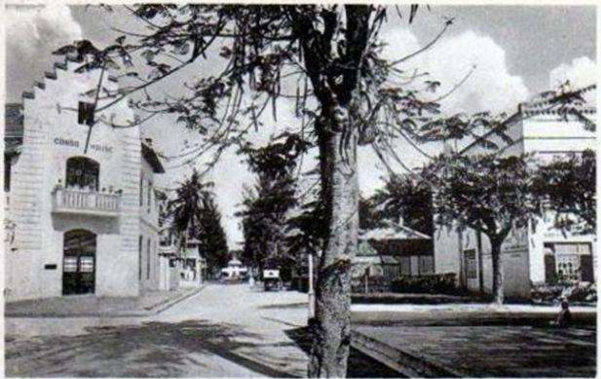
No. 44. Sulliman Street, Dar-es-Salaam.