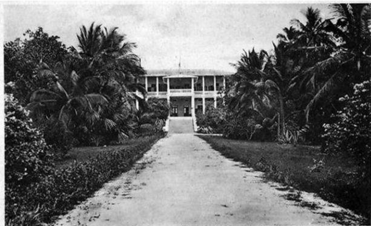
Gouverneur-Palais (Seeselte) — Dar-es-Salaam — Deutsch-Ost-Afrika

No. 25 Kunstverlag C. Vincenti, Dar-es-Salaam, D.-O.-Afrika. Gestaltet geschätzt.