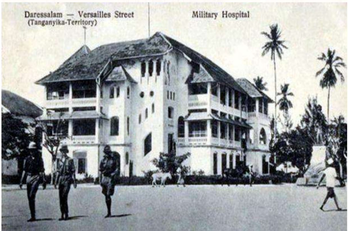
Daressalam — Versailles Street (Tanganyika-Territory)