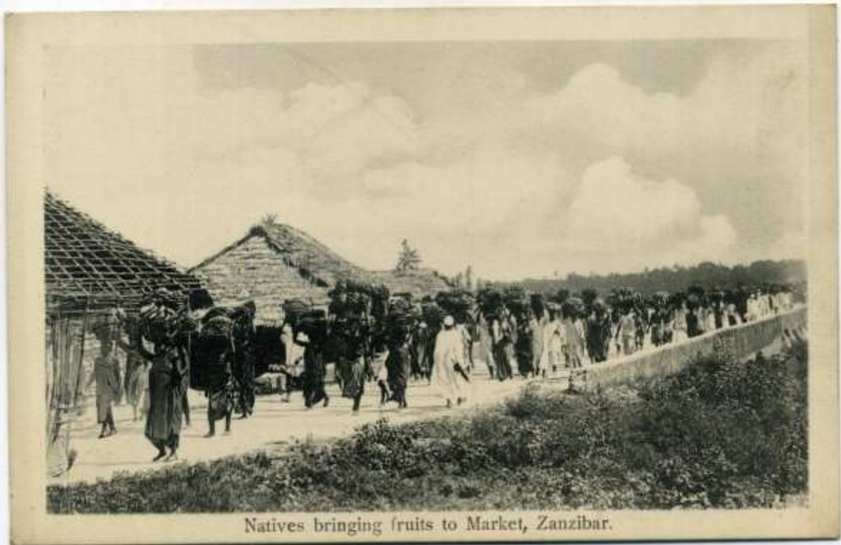
Natives bringing fruits to Market, Zanzibar.