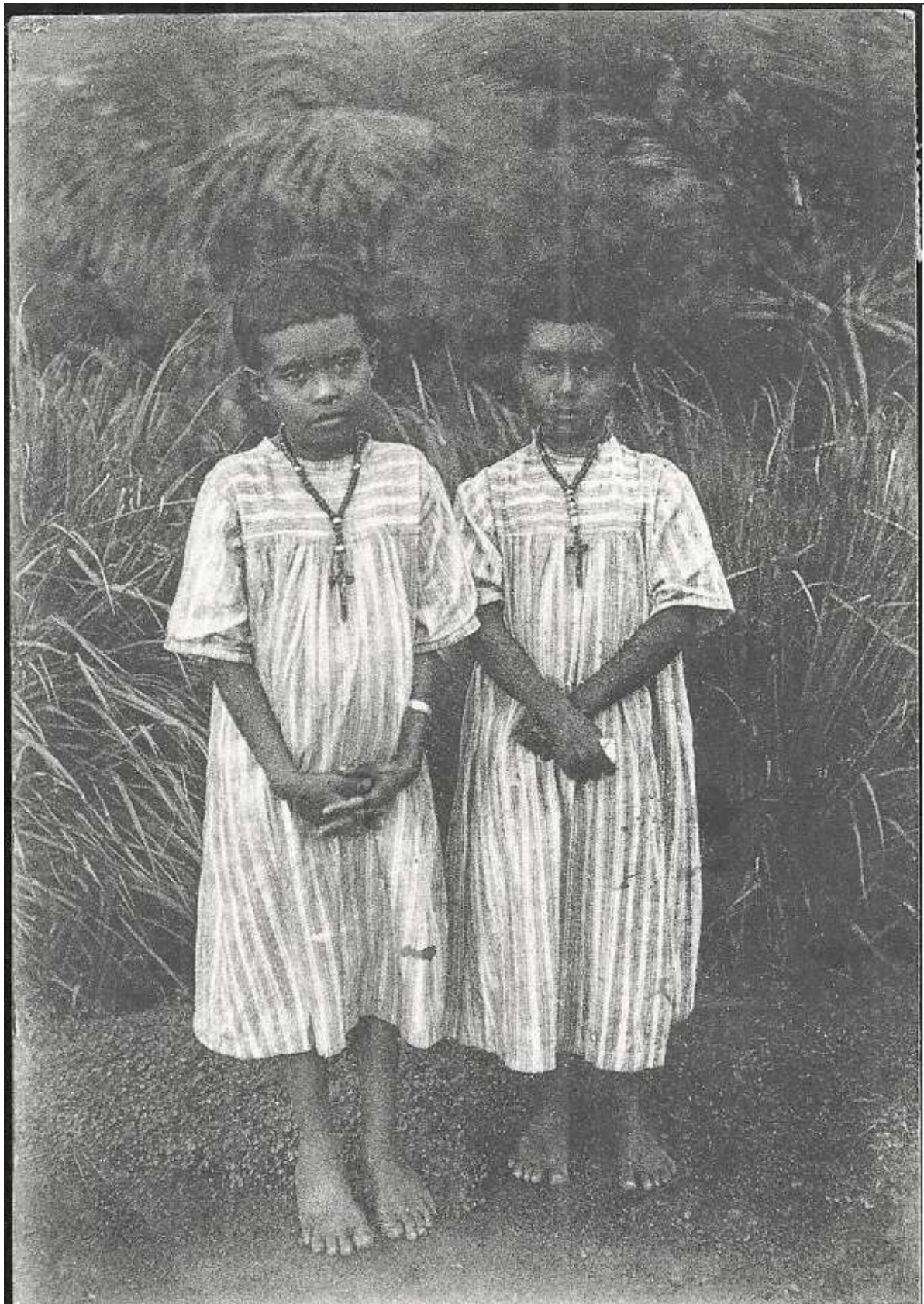
Aus dem Mädcheninternat in Korrer, Palau-Inseln.