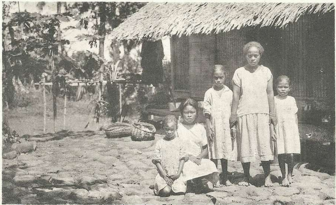
The manners and customs of the natives, Palau.