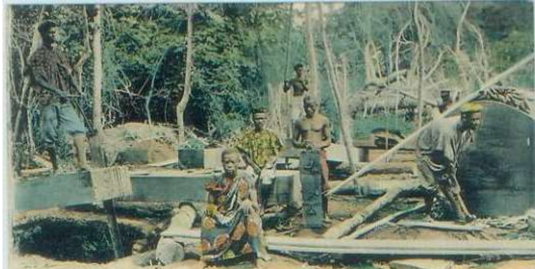
Sawers of Odumboards in Asante, Gold-Coast, Westafrica.