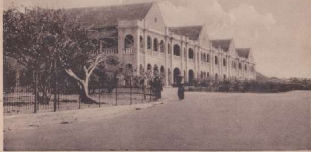
The Secretariate, Accra.